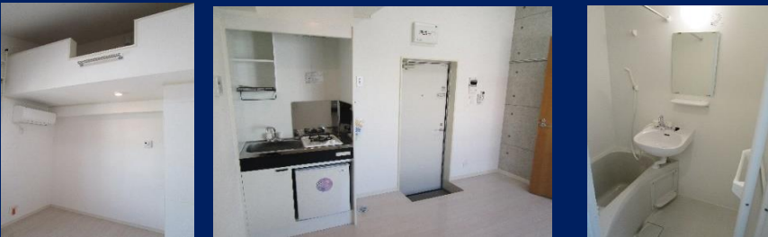
ロフト(302号室) 室内(302号室) 浴室(302号室) ※図面と現況が異なる場合は、現況優先とさせていただきます。